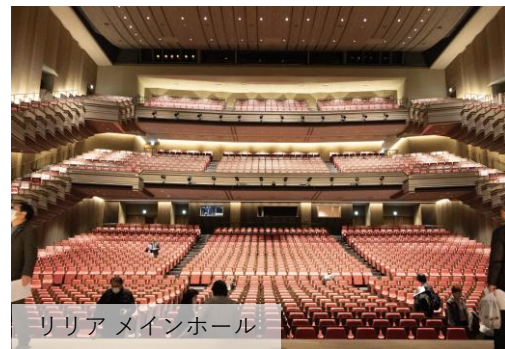
リリア メインホール

川口市立美術館(9月営業開始予定) 埼玉県川口市川口3-1-2 川口総合文化センター・リリア(7月営業再開予定) 埼玉県川口市川口3-1-1