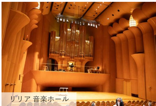
リリア 音楽ホール